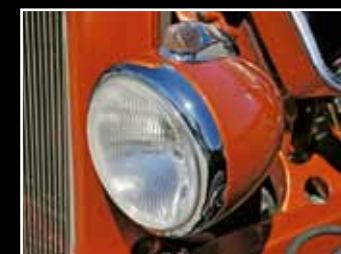
Stylová pouzdra světlometů se opět dodávají, uvnitř je žárovka H4