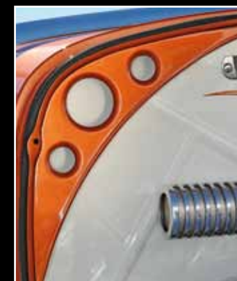
Mnoho míst je vyztužených perforovaným ocelovým plechem

Motor: OHV-V8, Chrysler Firepower Hemi, 392 cu.i, 6.425 cm 3 , 380 koní při 5.200 ot/min (výkon sériového motoru), polokulovité spalovací prostory, kompresní poměr 10:1, elektronicky řízené vstřikování paliva Hilborn * Přenos hnací síly: čtyřstupňová automatická převodovka GM 200R 4, zadní náprava Lynn – Racing – Quick – Change, pohon zadních kol * Přední náprava: tuhá náprava s podélnými rameny („Hairspin“), příčná listová pružina, teleskopické tlumiče * Zadní náprava: tuhá náprava na podélných ramenech, příčná listová pružina, teleskopické tlumiče * Brzdy: hydraulické bubnové brzdy na všech kolech, ABS * Kola: ocelové ráfky z Dodge trucku 1934, navážené na střední části disků Chevrolet, chromované poklice Moon-Cap * Pneumatiky: diagonální Firestone Dirt Track, vpředu 5,00x16, vzadu 8,9x16