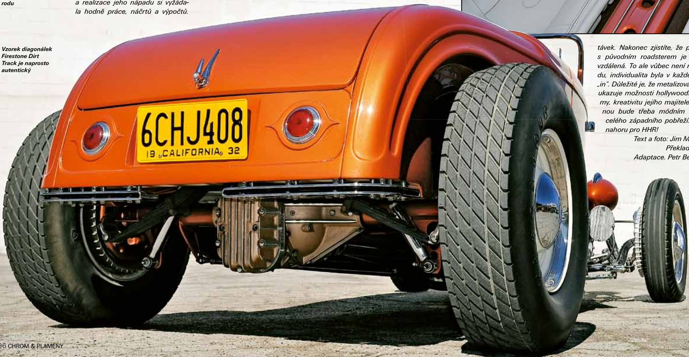
Vzorek diagonálek Firestone Dirt Track je naprosto autentický

távek. Nakonec zjistíte, že podoba s původním roadsterem je pouze vzdálená. To ale vůbec není na škodu, individualita byla v každé době „in“. Důležité je, že metalizovaný rod ukazuje možnosti hollywoodské firmy, kreativitu jejího majitele a jednou bude třeba módním stylem celého západního pobřeží. Palec nahoru pro HHR!