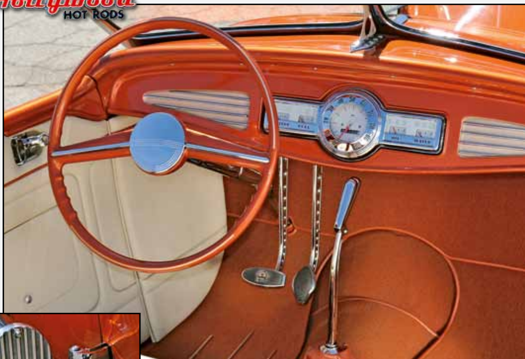
Leštěná ocel a chromované dveřní závěsy potvrzují vysokou kvalitu práce

část rámu se zvedá o celých pět palců, a to s běžnou karoserií prostě nelze. Troyova kreativita zase přišla v pravou chvíli, a realizace jeho nápadu si vyžádala hodně práce, náčrtů a výpočtů.