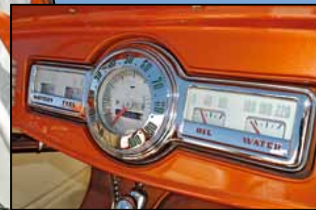
Decentní přístrojový panel poskytl Pontiac 1941

bezpečnostních požadavků použil i ABS. Otevřená karoserie roadsterů Ford 1932 dnes ve velké většině nepochází od dearbornského gigantu, ale z dílny firmy Brookville. Ve jménu úcty k předválečné