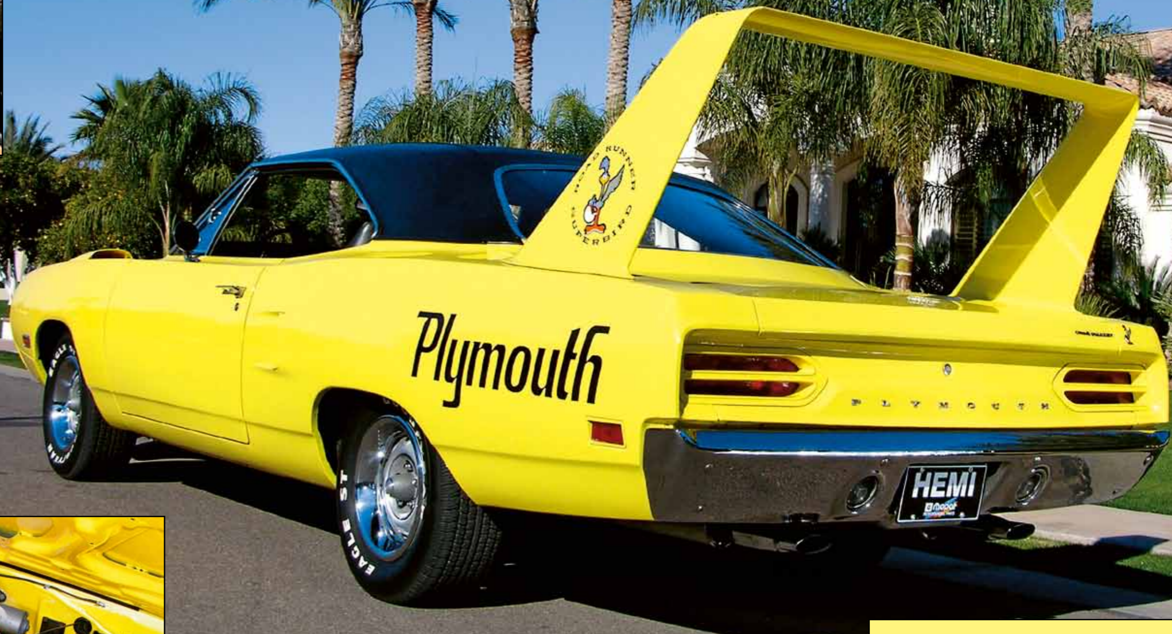
God Bless Hemi! Legendární agregát dělá ze Superbirdu tu největší raritu. Tuhle Heavy-Duty stroje s 425 koňmi dostalo pouhých 135 vozů

Plymouth Superbird na našich snímcích je vzácně zachovalý originál v původním odstínu „Lemon Twist“. Jeho současný a na vlastní přání nejmenovaný majitel jej nakonec našel v arizonské Mese u firmy „Town&Country“. Dnes má „superpták“ najetých 39.500 mil a jeho Hemi 426 pracuje jako zamlada. Srdce nadšence potěší i příplatková výbava, např. dřevěný obklad středové