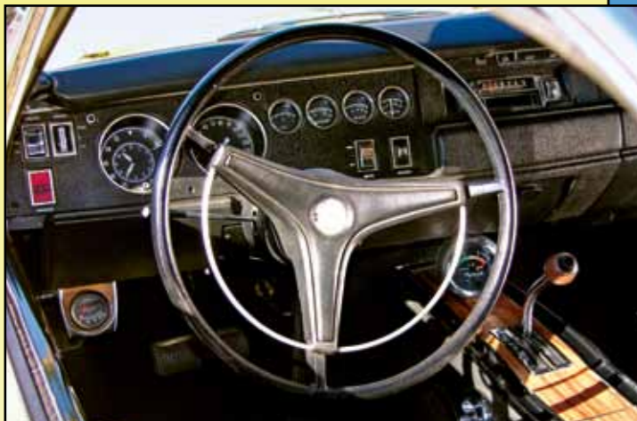
Třiramenný volant byl ve standardní nabídce Road Runneru i Superbirdu 1970

Zatímco se Daytony prodávaly naprosto normálně, u Superbirdů tomu bylo jinak. Někteří zájemci evidentně nebyli připraveni na masný doplatek za extravagantní auto, takže se jej prodejci nakonec zbavili jen přestavbou na „běžný“ Road Runner, a to ještě jen proto, aby si vyčistili sklad od „ležáků“. Z dnešního pohledu nepochopitelné řešení, ale tehdy ekonomická realita.