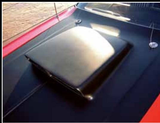
Černě lakovaná kapota neprozrazuje, co se děje pod ní. To bývala kdysi výjimka!