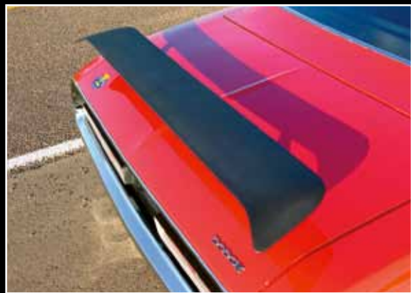
„Aerodynamic Rear Spoiler“ stál 54,65 USD a výrobce k němu dodal i malý přední nástavec