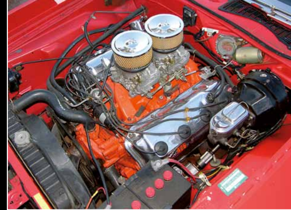
Zakázkový a superdrahý V8 426 cu.i. „Street Hemi“ s dvěma čtyřkomorovými karburátory. Výsledek? 425 koní v běžném provozu!