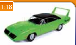
1:18 Plymouth Superbird Green Road & Track Magazine 1970 AUTOWORLD obj. č.: AMM995 1950 Kč