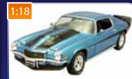
1:18 Chevrolet Camaro Baldwin Motion 1971 AUTOWORLD obj. č.: AMM1013 2100 Kč