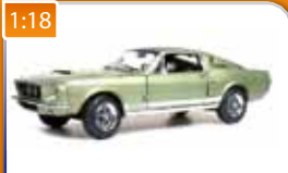
1:18 Shelby Ford Mustang GT500 Road & Car magazine 1967 AUTOWORLD obj. č.: AMM993 2150 Kč