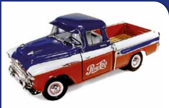
1:18 Chevrolet Pick up Cameo Pepsi 1957 AUTOWORLD obj. č.: AW207 2250 Kč