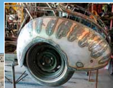
Na rozpracovaném blatníku je vidět to nesmírné kvantum práce

Je to „jen“ Ford '34 – ale proč by na chladiči nemohl nosit figuru „Flying Lady“, kterou se honosil Auburn let dvacátých?