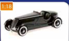
1:18 FORD EDEL MODEL 40 SPECIAL ROADSTER EARLY VERSION 1934 MINICHAMPS obj. č.: 107082040 6800 Kč