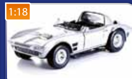
1:18 Chevrolet Corvette Grand Sport 1963 Fast and the Furious GREEN LIGHT obj. č.: GL12842 1450 Kč