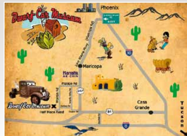
Mapka pro ty, kterým Dwarfs učarovaly. Přijďte, koukněte, ale nemluvte o koupi, Ernie je na tohle „nášlapný“...

Text: Kevin Guyan Překlad: J.F.K. Adaptace: Petr Bellinger