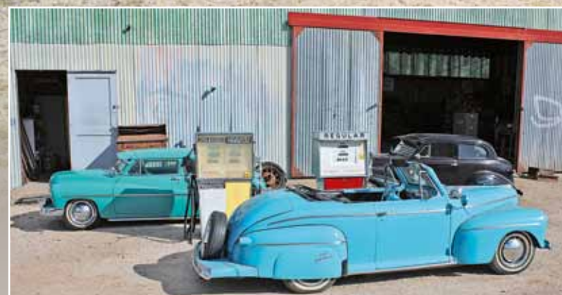
I trpaslík potřebuje svou dávku oktanů!