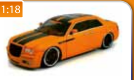
1:18 Chrysler 300 C NOREV obj. č.: 189400 850 Kč