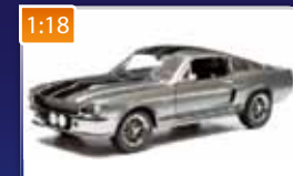
1:18 Ford Mustang Shelby GT500 60 Second Eleanor 1967 GREEN LIGHT obj. č.: GL12909 1950 Kč