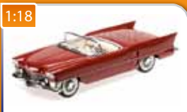
1:18 CADILLAC LE MANS DREAM CAR - 1953 MINICHAMPS obj. č.: 107148231 7850 Kč