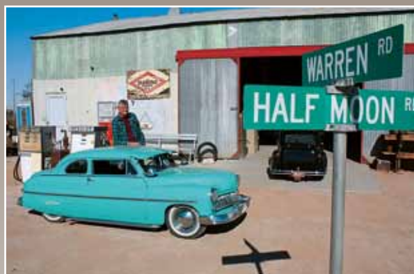
Mercury a jeho tvůrce pózuji před hlavní bránou muzea, vstupem do trpasličího ráje

Podívejte se na ten supersložitéy grill! To je umění i u skutečného auta, ale miniaturizace úplně bere dech!