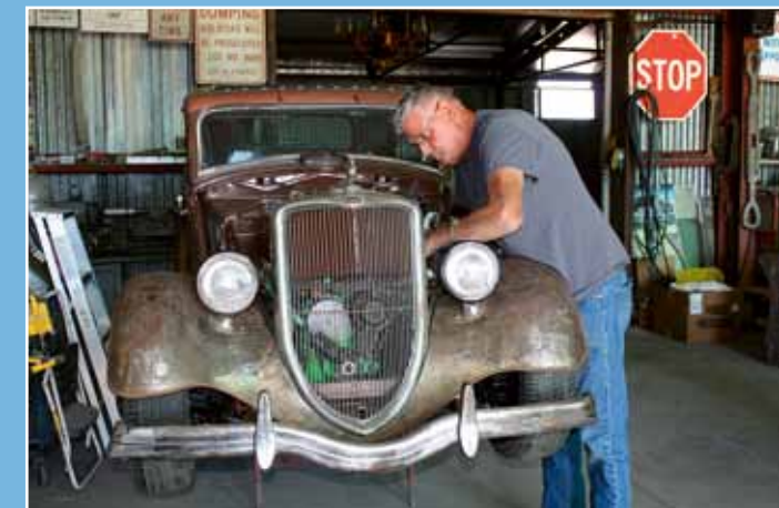
Tak, ještě doladit a jedeme na sraz!