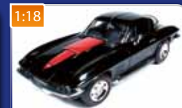
1:18 Chevrolet Corvette coupe 60th anniversary 1967 AUTOWORLD obj. č.: AMM1004 2100 Kč