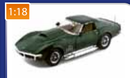
1:18 Chevrolet Corvette 482 1969 AUTOWORLD obj. č.: AMM1010 2100 Kč