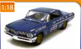
1:18 Don Gays Pontiac Catalina 4215C 1962 AUTOWORLD obj. č.: AW201 2350 Kč