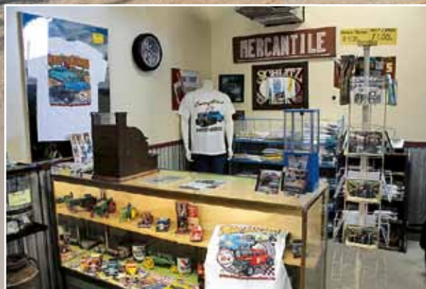
Při návštěvě muzea můžete navštívit dobře zásobenou prodejnu

Chevrolet Two-Door 1928 a pak přišel na řadu Chevy Sedan '39, zvaný „Precious memory“. Protože Ernie takovým exemplářem jezdil až do roku 1999 a natočil s ním více než 57.000 mil, dal si na něm fakt záležet. Chevrolet má tedy topení, ventilaci, stěračce a dokonce i otevírací schránku v palubní desce. A tlačítka také nemusíte – Chevy je poháněn čtyřválcem Toyota o výkonu 65 koní. Další „majstrštyk“ je Ford Convertible 1942, zvaný „Sweet Little Sheila“. Elegantní modré kabrio spatřilo světlo světa až po sedmi dlouhých letech práce. Také pod jeho zmenšenou kapotou pracuje čtyřválec Toyota Corolla: japonské agregáty budou zřejmě další vášní pana Adamse. Pak přišel na řadu Ford 1929 „Hillbilly“, dovedený do módního stylu „krysáku“. Rat Rod podle zavedených pravidel postrádá jakýkoliv náznak čalounění a marně byste pátrali i po laku. I kompletní „krysák“ byl hotový za tři měsíce, samozřejmě opět pomocí osvědčeného plechu ze starých lednic a podobného zařízení, zavazadelník původně sloužil jako část mrazáku. Fascinující Mercury '49 „Rebel Rouser“ je miniatura exempláře, vystupujícího ve slavném filmu „Rebel without a Cause“. Za jeho volantem tehdy seděl mladý James Dean, jemuž