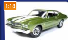
1:18 Chevrolet Chevelle SS AUTOWORLD obj. č.: AMM1028 2100 Kč