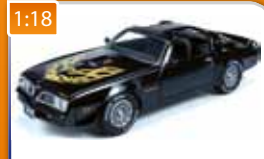
1:18 Pontiac Firebird Trans Am 1977 AUTOWORLD obj. č.: AWR1115 1850 Kč