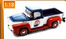
1:18 Ford Pick-up F-100 Pepsi 1956 AUTOWORLD obj. č.: AW216 2250 Kč