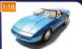
1:18 Chevrolet Corvette Convertible 1986 GREEN LIGHT obj. č.: lg18802 1750 Kč