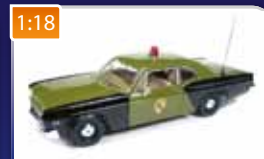
1:18 Chevrolet Biscayne Maryland State Police 1966 AUTOWORLD obj. č.: AMM1030 2250 Kč