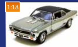
1:18 Chevrolet Centennial Nova SS396 Chevy 100th Anniversary 1969 AUTOWORLD obj. č.: AMM804 2250 Kč