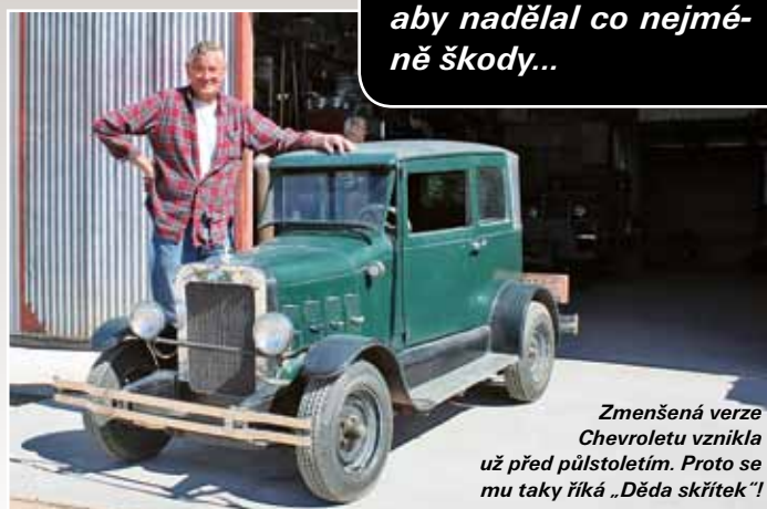
Zmenšená verze Chevroletu vznikla už před půlstoletím. Proto se mu taky říká „Děda skřítek“!