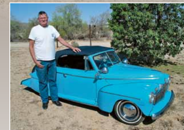
Ford DeLuxe Convertible 1942. Neuvěřitelné, ale střeha se skládá pomocí hydrauliky!