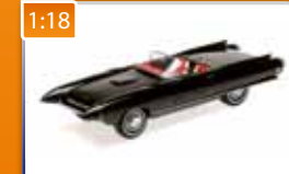
1:18 CADILLAC CYCLONE XP 74 CONCEPT - 1959 MINICHAMPS obj. č.: 107148221 7850 Kč