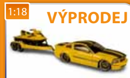
1:18 Ford Mustang + Jet Ski Parotech Cesam NOREV obj. č.: 182707 950 Kč