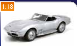
1:18 Chevrolet Corvette Cabrio 1969 AUTO ART obj. č.: 71162 2550 Kč