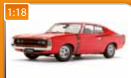
1:18 Chrysler Charger E49 AUTO ART obj. č.: 71505 2550 Kč