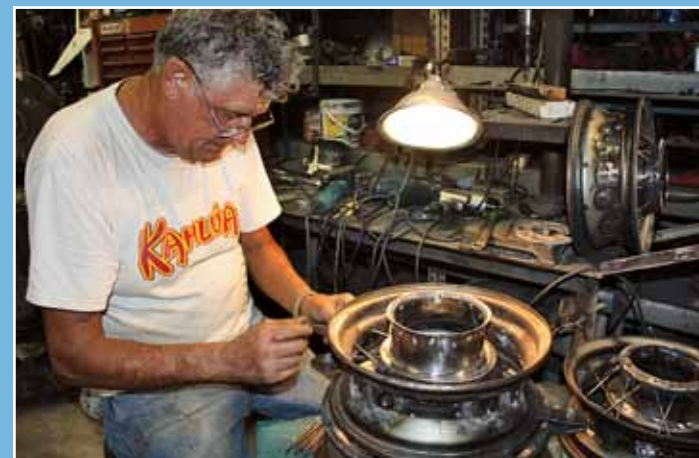
Výroba kola s drátovým výpletem. Každá maličkost je propracovaná do nejmenšího detailu

Zmenšení a přesnost miniaturizace vynikne nejlépe ve srovnání s trpasličím Mercury '49 a Buickem Series 90 normální velikosti