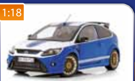
1:18 Ford Focus Rs - 2010 - Le Mans Classic Edition 1972 Ford Capri Rs MINICHAMPS obj. č.: 100080072 2450 Kč