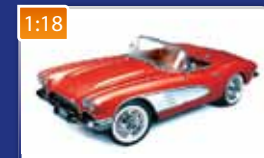
1:18 Chevrolet Corvette convertible 1961 AUTOWORLD obj. č.: AMM991 2100 Kč