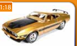
1:18 Ford Mustang Mach 1 1973 AUTOWORLD obj. č.: AMM1043 2500 Kč