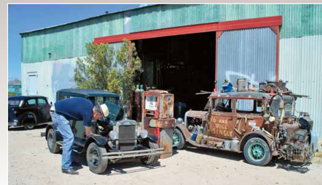
Vpředu Chevy '28, vedle „Hillbilly“ Ford '29, vyrobený později

Navzdory oceli z vyřazeného oplechování ledniček je Chevy udělaný fakt mistrovsky a v této podobě zůstal, třebaže Ernie kdysi prohlásil, že je to jen provizorium. V muzeu můžeme obdivovat šestici minicruiserů a návštěvník se většinou rozhlíží kolem a čeká, odkud se vyno-