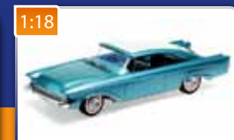
1:18 CHRYSLER NORSEMAN 1956 MINICHAMPS obj. č.: 107143320 9200 Kč