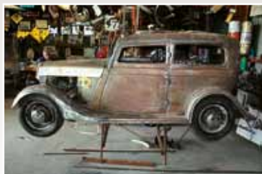
„Suicide Doors“ nesmí chybět

pracovních hodin. Všechno na koleně, jen se základní sadou nástrojů a pomůcek. Každá stavba začíná množstvím skic a obrazů skutečného automobilu ze všech možných úhlů. Hodně pracné je přepočítávání poměrů a kótování, protože Ernie chce zachovat měřítko nejen v hrubé stavbě, ale i v detailech. Základem všeho je pevný rám a jeho další součásti. Také k tomu jsou potřeba (nejlépe tovární) výchozí podklady, podle nichž se změří a přizpůsobí každá příčka či nosník. Každý omyl nebo přehlédnutí se vymstí během finalizace prací a nenávratně může zničit optiku modelu. Mnoho součástek Ernie vyrábí odléváním, takže si