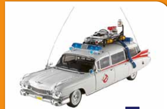
1:18 Cadillac Ambulance Ghostbusters Movie HOTWHEELS obj. č.: BCJ75 1850 Kč