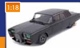
1:18 Chrysler Imperial BLACK BEAUTY - GREEN HORNETTV SERIES FROM 1966 AUTO ART obj. č.: 71546 6450 Kč