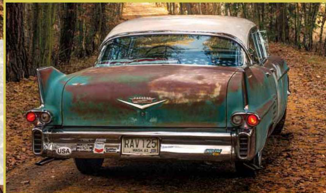
Éra raketového věku se nejvíce podepsala na zadní části vozu. Designéři si pohráli i s funkčností detailů – hrdlo nádrže objevíte až po vyklopení levé zadní svítilny

Cadillac. Byl ochoten se smířit s tím, že za něj utratí 214 dolarů navíc, a že když přidá pár dalších „drobností“ jako třeba rádio nebo elektrická okna, bude nakonec jeho auto stát skoro stejně jako základní Deville. Inu což, auto si člověk kupuje párkrát za život.