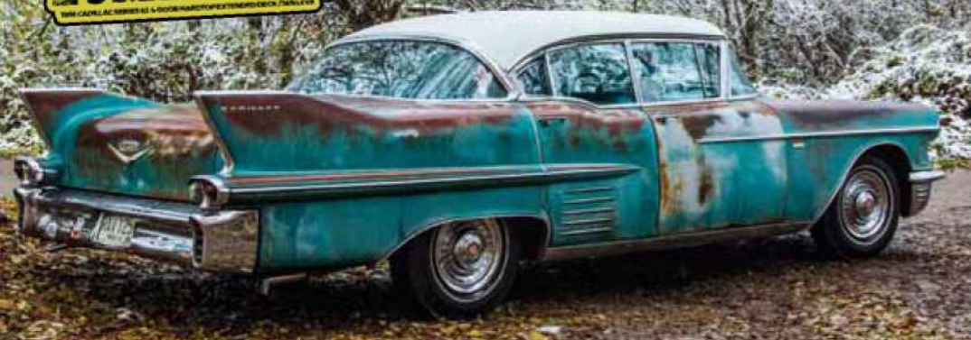
V zasněženém lese Zombielac splývá s okolím a jakoby čeká na svou kořist...

věci a přestal věřit lidem. Slýchali ho mluvit o tom, že země, která už ani neumí vyrobit pořádné auto, je odsouzená k zániku a že lidé z měst se definitivně zbláznili.