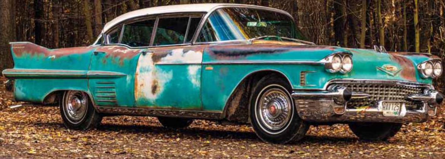
Ladné křivky prodloužené Extended Deck verze vyniknou i přes omšelý kabát. S délkou 225 palců vzbuzoval Zombielac respekt i v dobách, kdy dinosauři křížníky stály v Americe na každém rohu...