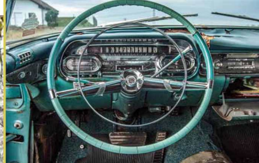
Palubní deska jeví známky opotřebení a letitého pobytu na slunci, přesto zůstala zcela kompletní a funkční!