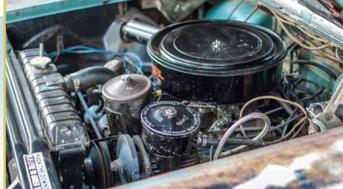
Pod kapotou duní původní šestilitrový osmiválec, vše zůstalo na svém místě kromě kompresoru vzduchového podvozku

Jenomže Jeremiah, majitel vedlejšího ranče, říkal onehdy, když se setkali před kostelem, že prodeje nových aut nejdu, a tudíž jsou dobré ceny. A radil Jamesovi, že má zajít za jeho synovcem, který vlastní v nedalekém městě prodejnu značky Cadillac. Jeremiah ho také svezl autem, které synovec pořídil jemu – mělo novinku, jakýsi „vzduchový podvozek“ a na rozbitých cestách kolem jejich městečka se vznášelo jako na polštáři.