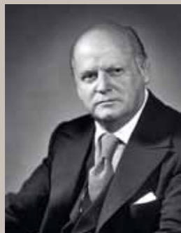
William „Bill“ Mitchell

Geniální a suverénní designer a vizionář, v některých ohledech ale současně komplikovaný a rozporuplný člověk, milovník závodů, rychlých aut, krásných žen a Karibiku, a nejlépe všech těchto radostí dohromady... Vydejme se prozkoumat milníky života jednoho z nejvlivnějších lidí v zákulisí General Motors!