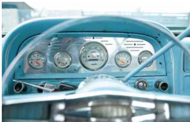
Vše potřebné před očima: určitě ale neuhodnete, že řidič nesleduje hodnoty na původních přístrojích. Ty byly totiž minulým majitelem vyměněné za přístrojový štít s lehkým kustomizíngem

negativnímu sklonu přidě nepůsobí humpolácky. Horní část je jednoduše stylistická lahůdka, okamžitě schopná upoutat pohled i toho nejlhostejnějšího kolemjdoucího. Dva nízké, vejčité elementy tvoří pokračování prolisů kapoty, táhnoucích se už od spodního okraje skla. Na rozdíl od lichoběžníkových tvarů dolní části jsou zaoblené a obsahují kromě lesklého dekoru i pozíčky/blikače. Mezi nimi je velké logo Chevroletu, a hned pod ním otvor pro ruku k otevření kapoty. Prohlížení detailů je naprostá lahůdka, na níž si zrak bude pochutnávat hodně dlouho. Dá se říci, že obdobnou individualitu už Chevy ve své užitkové řadě nikdy nepřinesl. Kabina upoutá panoramatickým předním oknem (podobné finesy měly i modely full-size ročníku 1959, vzpomínáte?), samozřejmostí jsou sloupky s negativním sklonem. Bok vozu zkrášluje chromovaná lišta, táhnoucí se od výřezů předních kol až na samou zád, kde končí efektní ostruhou. Uvnitř útulné kabiny panuje podobná designová nálada, jakou se pyšnily i drahé osobní modely. Původní modrý odstín nádherně koresponduje s elegantní modro-bílou kombinací exteriéru, základním tvarovým elementem se stala dvojice zaoblených štítů před řidičem i spolujezdcem (jen ten třetí pasažér uprostřed přijde zkrátka ©). Před spolujezdcem obsahuje objemnou uzamýkací schránku, štít před řidičem tvoří