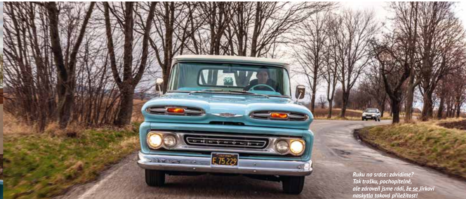
Ruku na srdce: závidíme? Tak trošku, pochopitelně, ale zároveň jsme rádi, že se Jirkovi naskytlá taková příležitost!