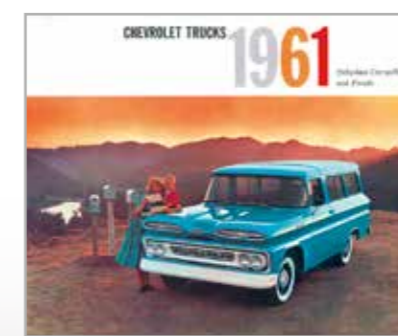
Ročník 1961 nabídl výjimečný stylistický výstřelek i u osobního Suburbanu. Většina jich jezdila se zadní hnanou nápravou

to nejnovější a nejlepší, co vám dneska Chevrolet může nabídnout! Podívejte se na tu nádheru! Osmiválec do V, 283 inčů, dvoukomorový karburátor a 160 koní, kteří vás budou poslouchat ve dne v noci. A jmenuje se Trademaster! Plácnete si? A s pohledem pod kapotu „našeho“ dvoubarevného Apache vidíme, že si první majitel s prodejcem fakt plácnul. Objednal si nejen silnou véosmičku, ale k tomu i příplatkovou automatiku a luxusní kabinu Comfort King. Tady se určitě cítil jako pasažér toho nejmodernějšího osobního Chevroletu. Jeho nová akvizice na něj hleděla přídí budící respekt. Nárazník je tradičně mohutný, ale vzhledem k nepatrně