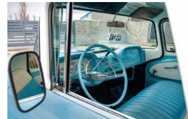
Pohled na „řídící centrum“ odhalí dvojici panelů, z nichž levý obsahuje přístroje, pravý zamykací schránku

ročníků 1960 a 1961. Stejně tak i Apache 20 zahrnující všechny třičtvrtětuny a Apache 30 se všemi jednotunkami. Od populární „Cé desítky“ výrobce odvodil i verzi s pohonem všech kol, minibus Suburban, panelovou dodávku, ale prodával i šasi s kabinou a mechanickými komponenty pro montáž dalších účelových nástaveb (například objemných ambulancí nebo school busů). Zákazník si jako obvykle mohl zvolit provedení Fleetside s blatníky uvnitř nákladového prostoru nebo Stepside se zřetelnými blatníky na bocích.