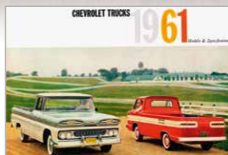
Nabídka ročníku 1961 začínala Corvairé, ale pak šlo jedno UFO za druhým: 10, 20, 30 a 40

numentalitu hodně přibrzdil, tak přizpůsobil aspoň ty užitkové přepravníky. Zato se ale vrhnul na všechny, počínaje malými půltunovými C10 a C15 a konče monumentálním těžkotonážníkem Spartan, počítaje v to i sesterský GMC. Celá story jedinečného designu začala s modelovým rokem 1960. Stejně jako z jiného světa působila Impala 1959 proti Bel Airu 1954, působil pick-up Chevrolet 1960 proti modelu z předchozího roku. Snad jen ještě nápadněji: nebylo tu totiž žádné několikaleté přechodové období jako u osobních řad, takže Amerika si nemohla postupně přivykat. Jednoho dne byli návštěvníci prodejen užitkových vozidel Chevy vystaveni ráně do hlavy, a jen se jim přestalo zatmívat před očima, uvědomili si, že