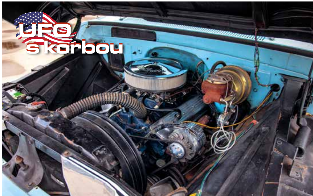
Pod kapotou je dost místa i na větší agregát, ale osmiválcový Trademaster s výkonem 160 koní naprosto vyhovuje