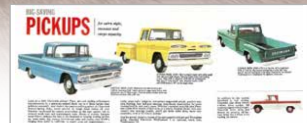
Vlevo základní provedení Fleetside, žlutý a zelený pick-up má viditelné blatníky a název Stepside

„Našlo se samozřejmě pár maličkostí, které jsem musel udělat. Prohlédnout brzdy, vyměnit náplně a filtry, ale to takhle dělám vždycky. Chevy měl ještě