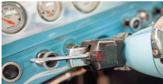
Zajímavé řešení páčky směrovek kombinované s tlačítkem varovných blikáčů. Známe i z větších trucků...

negativnímu sklonu přidě nepůsobí humpolácky. Horní část je jednoduše stylistická lahůdka, okamžitě schopná upoutat pohled i toho nejlhostejnějšího kolemjdoucího. Dva nízké, vejčité elementy tvoří pokračování prolisů kapoty, táhnoucích se už od spodního okraje skla. Na rozdíl od lichoběžníkových tvarů dolní části jsou zaoblené a obsahují kromě lesklého dekoru i pozíčky/blikače. Mezi nimi je velké logo Chevroletu, a hned pod ním otvor pro ruku k otevření kapoty. Prohlížení detailů je naprostá lahůdka, na níž si zrak bude pochutnávat hodně dlouho. Dá se říci, že obdobnou individualitu už Chevy ve své užitkové řadě nikdy nepřinesl. Kabina upoutá panoramatickým předním oknem (podobné finesy měly i modely full-size ročníku 1959, vzpomínáte?), samozřejmostí jsou sloupky s negativním sklonem. Bok vozu zkrášluje chromovaná lišta, táhnoucí se od výřezů předních kol až na samou zád, kde končí efektní ostruhou. Uvnitř útulné kabiny panuje podobná designová nálada, jakou se pyšnily i drahé osobní modely. Původní modrý odstín nádherně koresponduje s elegantní modro-bílou kombinací exteriéru, základním tvarovým elementem se stala dvojice zaoblených štítů před řidičem i spolujezdcem (jen ten třetí pasažér uprostřed přijde zkrátka ©). Před spolujezdcem obsahuje objemnou uzamýkací schránku, štít před řidičem tvoří