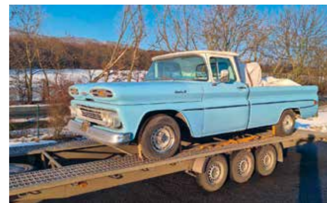
A takhle u nás zakotvil. Po dlouhém putování přes Atlantik se Apache vylodil v Rotterdamu a cestou domů poznal i sněh...