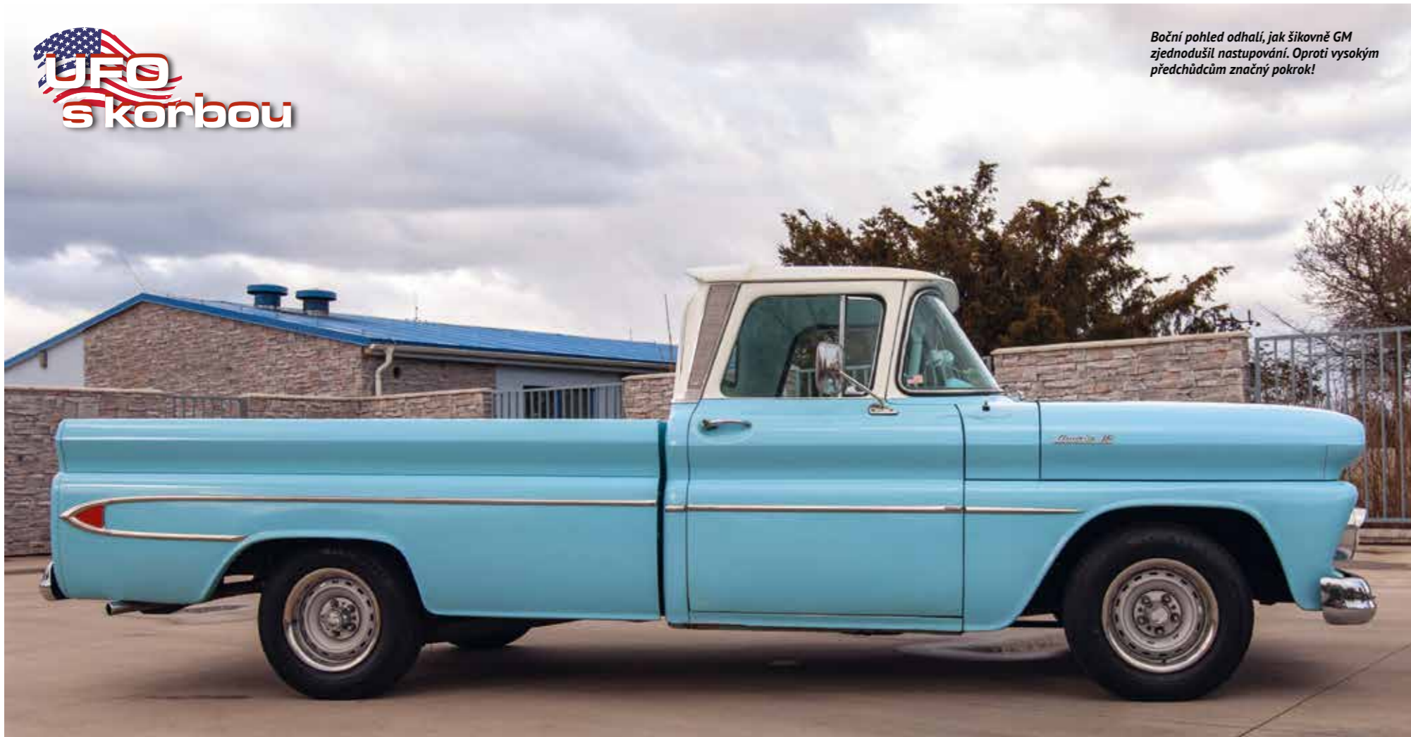
Boční pohled odhalí, jak šikovně GM zjednodušil nastupování. Oproti vysokým předchůdcům značný pokrok!