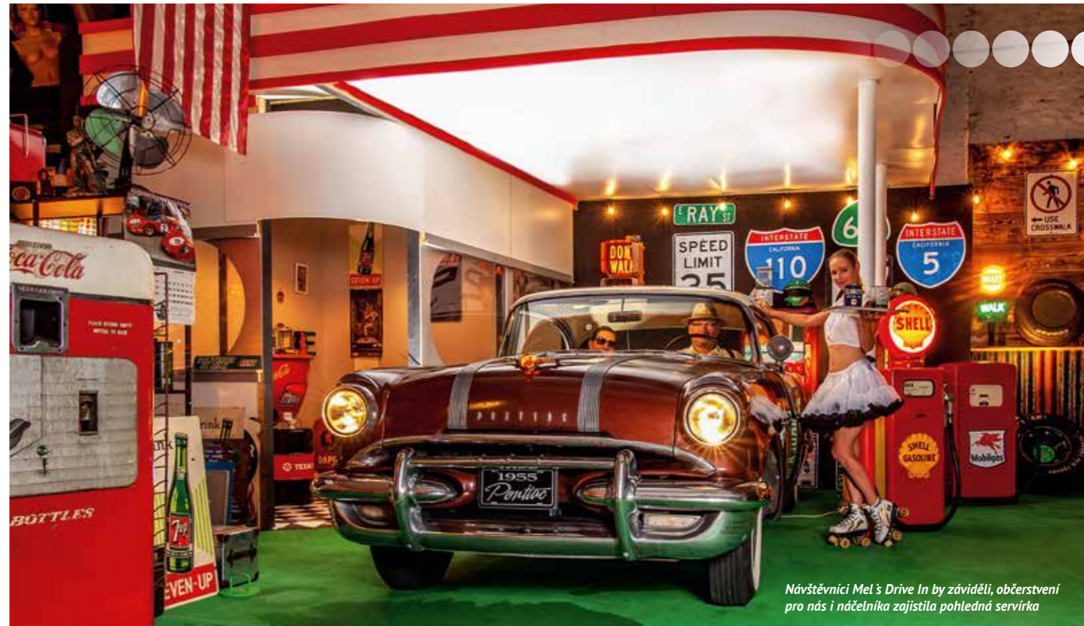
Návštěvníci Mel's Drive In by záviděli, občerstvení pro nás i náčelníka zajistila pohledná servírka

Pro focení jsme využili i obchůdku (Stará Garáž) souseda ve vesnici, jeho dekorace se krásně hodily k našemu náčelníkovi