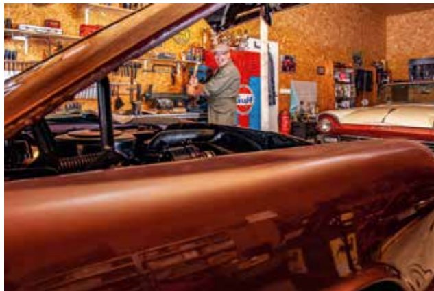
Velká garáž a dobře vybavená dílna jsou základ pro práce všeho druhu na starých amerických. Jednoduchá technika a nepřeborné množství informací zajistí skoro každému projektu na vozech Made in USA úspěch