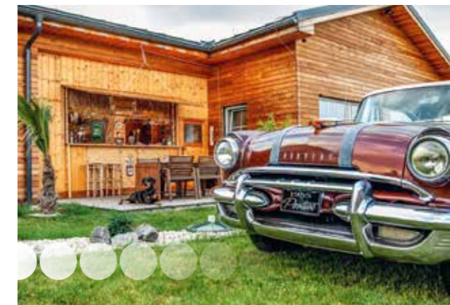
Pes, palmy, Pontiac a tiki bar, co si více přát...