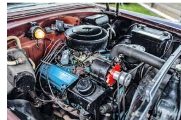
Underhood trouble lamp si posvítil na původní motor se čtyřbarelovým karburátorem Carter. Moderní alternátor jednoho dne nahradí původní generátor