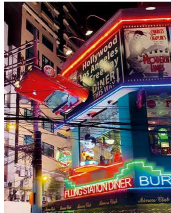
Vetknutý Cadillac Convertible 1960 láká kolenjdoucí... A úspěšně!