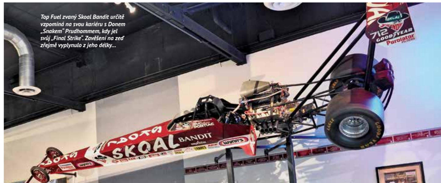
Top Fuel zvaný Skoal Bandit určitě vzpomíná na svou kariéru s Donem „Snakem“ Prudhommem, kdy jel svůj „Final Strike“. Zavěšení na zeď zřejmě vyplynulo z jeho délky...