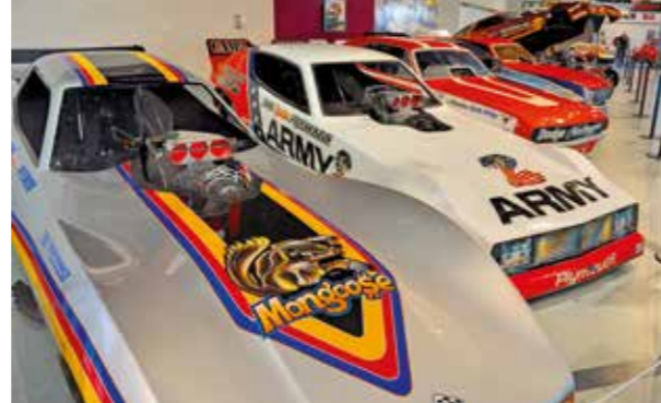
Funnies Snake a Moongoose účinkovaly v roce 2013 ve snímku o životě Dona Prudhommea a Toma. Jedná se o Plymouth Arrow ARMY a Corvette English Leather

V roce 2007 dojel Wally Parks na konec své životní dráhy. Bylo mu 94 let a za sebou nechal pozoruhodné dílo, známé po celém světě. Památník – muzeum s jeho jménem a rozsáhlou