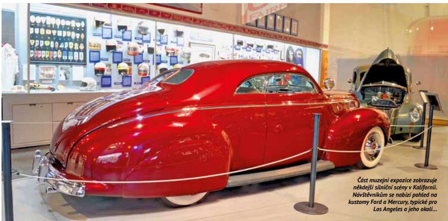
Část muzejní expozice zobrazuje někdejší silniční scény v Kalifornii. Návštěvníkům se nabízí pohled na kustomy Ford a Mercury, typické pro Los Angeles a jeho okolí...