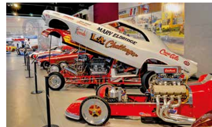
Funny Car Dodge Challenger vznikl v roce 1970 u firmy Fiberglass Trend pro závodníka Merva Eldridge