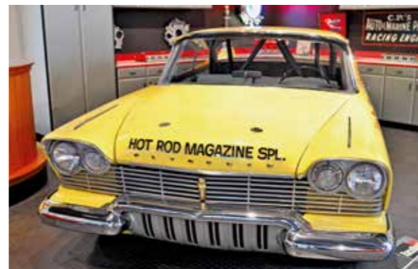
Plymouth Fury ročníku 1957 předvádí tehdejší bezpečnostní prvek: masivní trubkový rám