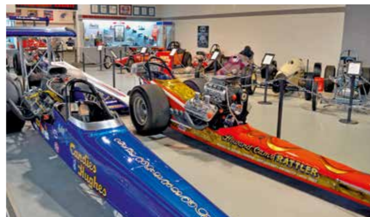
Extra dlouhé stroje představují dobu raných modelů Top Fuel s agregáty Hemi. První podoba měla motor před kokpitem, později se pohonná jednotka přestěhovala mezi jezdce a zadní nápravu