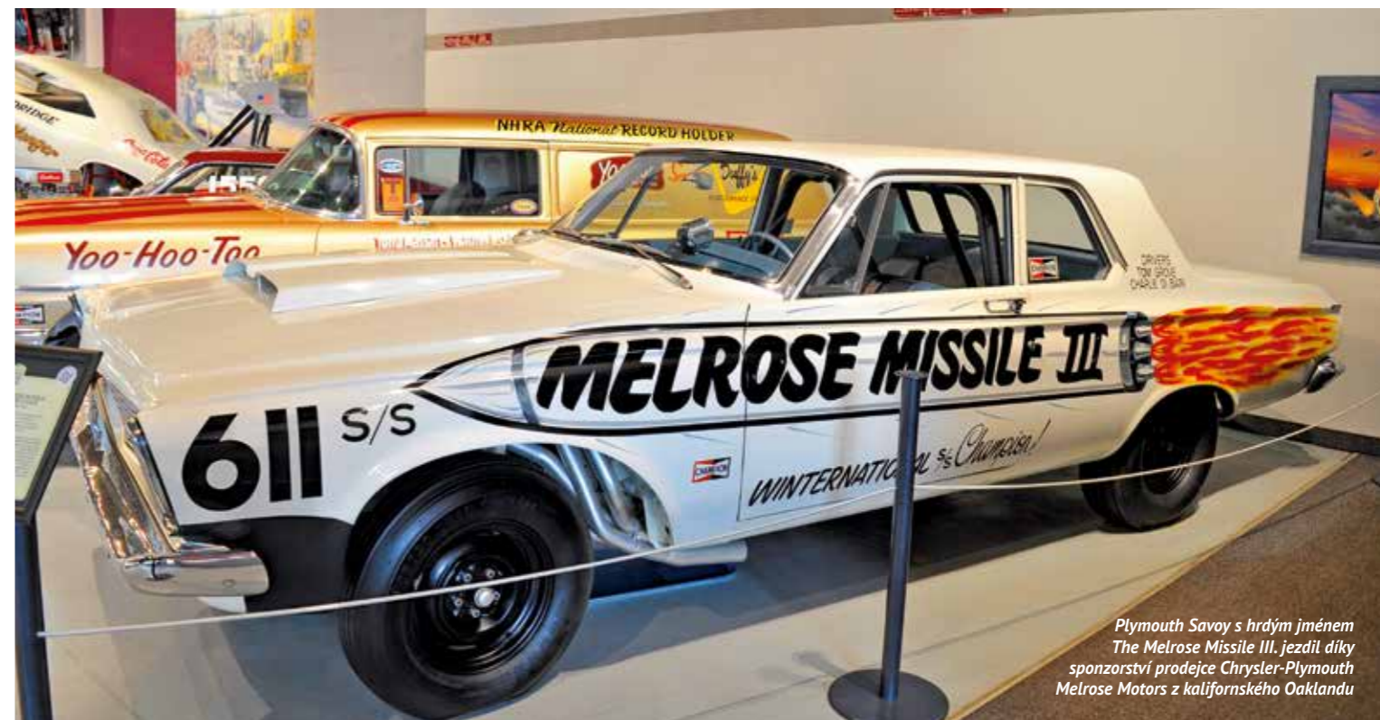
Plymouth Savoy s hrdým jménem The Melrose Missile III. jezdil díky sponzorství prodejce Chrysler-Plymouth Melrose Motors z kalifornského Oaklandu