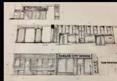
Od prvních tahů tužkou až po finiš na cílové rovině. Muzeum Nová Bystřice

za specializovanými společnostmi, které se kulisami živí. „To odhadujeme tak na 8-10 milionů, kdy se do toho můžeme pustit?“ Zkusil jsem žádat o speciální dotaci u Jihočeského kraje. Přeci jen se pyšním statusem nejkrásnějšího muzea v kraji, mohli by pustit chlup. Ne. Ani cent. Nezapadáme do tabulek. Pamatuji si, jak jsem seděl v prázdných halách, venku sněžilo a já neměl vůbec tušení jak z toho ven. No, jak...? Prostě si to vyrobíme sami!