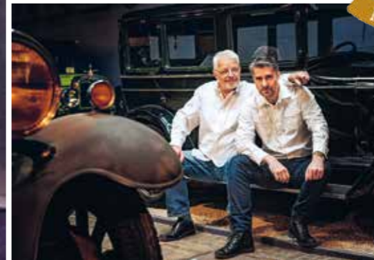
A to jsme my. Táta a já