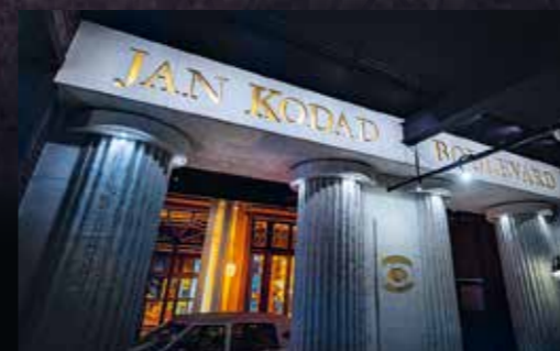
Honza jezdil do muzea často a rád. Teď je to nastálo