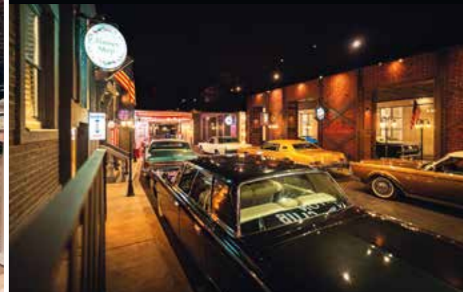
Americký boulevard s naleštěnými Lincolny a Imperialy

skutečnosti malá dušička, protože jsem věděl, že vytvořit důstojné pokračování stávající expozice nebude legrace. A pak už to šlo ráz na ráz. Ve Washingtonské národní knihovně mám kamarádku, která sáhla po dobových fotografiích ulic třicátých až padesátých let. Poslala jich desítky, ale na první dobrou jsem si vybral ty, které mne nějakým způsobem zaujaly. Pak jen změřit stěny hal, vzít tužku a papír a vše si nakreslit, rozvrhnout. Zachovat reálné poměry velikostí oken, dveří, výloh. Počítat s tím, že ulice, vlastně obecně kulisy musí být precizní, ale zároveň nesmí přebíjet to, co je tématem muzea – auta. Je to vratká rovnováha, která může umocnit, ale i pokazit celkový dojem z expozice. Šel jsem na Barrandov. Mluvil s kulisáky. Poslali mne