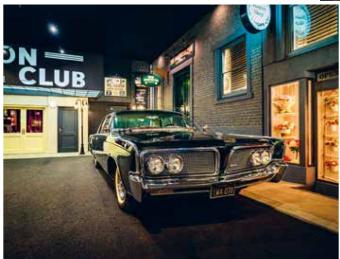
I takový Imperial mohl před Cotton Clubem stát. U nás určitě!