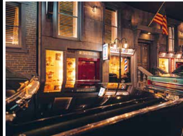
Ten dům „žije“ prohlásila jedna malá návštěvnice