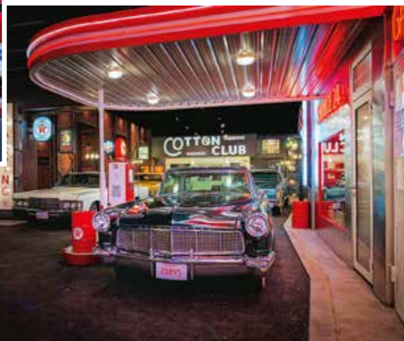
Byla by radost tankovat na takovém místě!