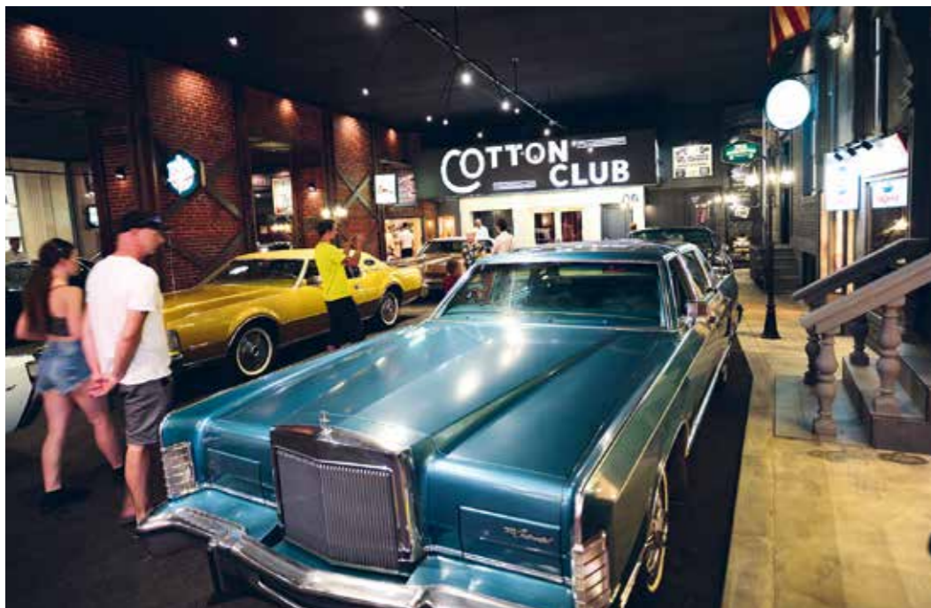
První hosté v nové části Muzea Veteranů