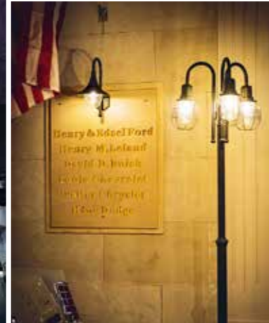
V detailech je síla. Jména amerických osobností