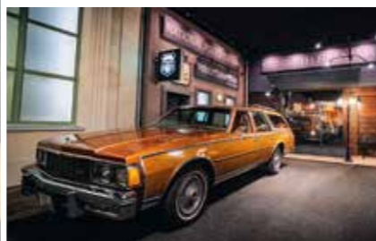
Chevrolet Caprice Estate Wagon ve velmi slušivé kombinaci