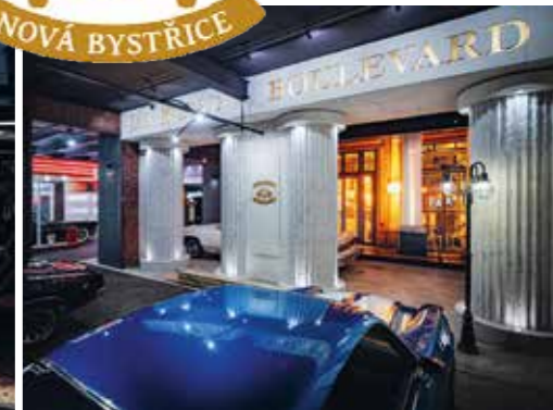
Důstojná vzpomínka na Honzu Kodada

skutečnosti malá dušička, protože jsem věděl, že vytvořit důstojné pokračování stávající expozice nebude legrace. A pak už to šlo ráz na ráz. Ve Washingtonské národní knihovně mám kamarádku, která sáhla po dobových fotografiích ulic třicátých až padesátých let. Poslala jich desítky, ale na první dobrou jsem si vybral ty, které mne nějakým způsobem zaujaly. Pak jen změřit stěny hal, vzít tužku a papír a vše si nakreslit, rozvrhnout. Zachovat reálné poměry velikostí oken, dveří, výloh. Počítat s tím, že ulice, vlastně obecně kulisy musí být precizní, ale zároveň nesmí přebíjet to, co je tématem muzea – auta. Je to vratká rovnováha, která může umocnit, ale i pokazit celkový dojem z expozice. Šel jsem na Barrandov. Mluvil s kulisáky. Poslali mne