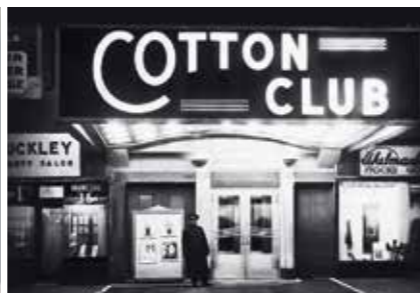
Originální fotka Cotton Clubu ze 40. let minulého století