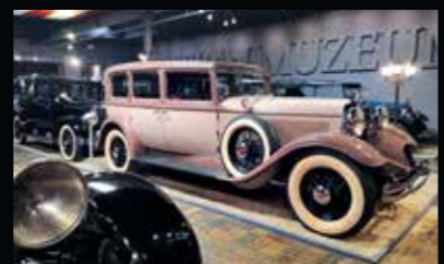
Lincoln K 1931. Po 7 letech renovace je hvězdou sálu 20. až 30. let

S konceptem rozvoje muzea formou prezentace aut v jejich nejpřirozenějším prostředí, tedy na běžné americké ulici, jsem se nijak netajil. Kamarády jsem bohatě zásobil vizemi, máchajíc rukama jsem jim před očima stavěl tady benzínku, tamhle průčelí americké banky a tady zase prodejnu zbraní hned vedle policejní stanice. Smáli se a ve mně byla ve