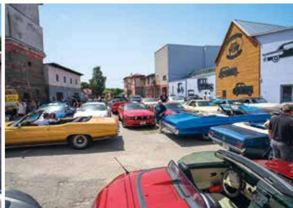
Letošní pátý ročník cesty do muzea, který jsme nazvali „Honzikova cesta“