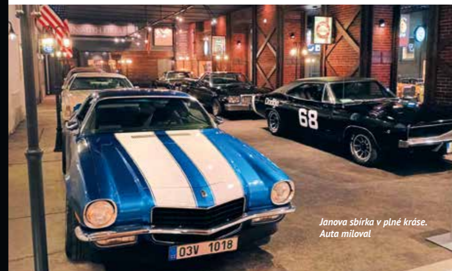
Janova sbírka v plné kráse. Auta miloval