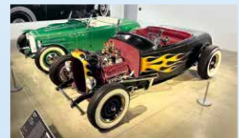
Ford Flathead Roadster 1932 hrál ve filmech Iron Man I. a II. Legendární Deuce odráží poválečnou kulturu mládeže lačnickí po rychlosti v odlišném kabátě