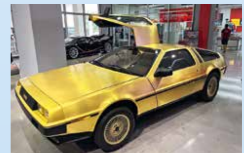
Delorean DMC-12 pozlacený 24karátovým zlatem, jeden ze tří kusů vytvořených pro American Express promotion