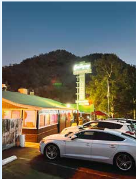
Přilehlý Restaurant Gateway je obklopený divokou přírodou se spoustou medvědů. Místní s nimi už umí žít, my se to teprve učili