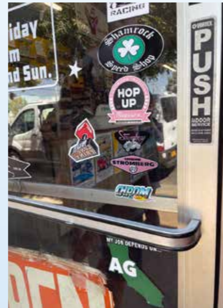
Samolepku CHROM na vstupní dveře svého podniku nalepil sám Timmy McMaster. Nám tím pochopitelně udělal velkou radost!

horská silnice se klikatí nádhernou přírodou po stěnách hor a na hranách hlubokých srázů. Převodovce našeho Transitu se to ale nelíbí, desetistupňový automat je za trest, a tak celé stoupání řadím tlačítka +/- a modlím se, aby to transmise vydržela. Pobyť mezi gigantickými sekvojemi je ozdravný a motivující. Člověk si pod jejich korunami uvědomí, jaký je oproti nim mravenec a zároveň ho aspoň na chvíli