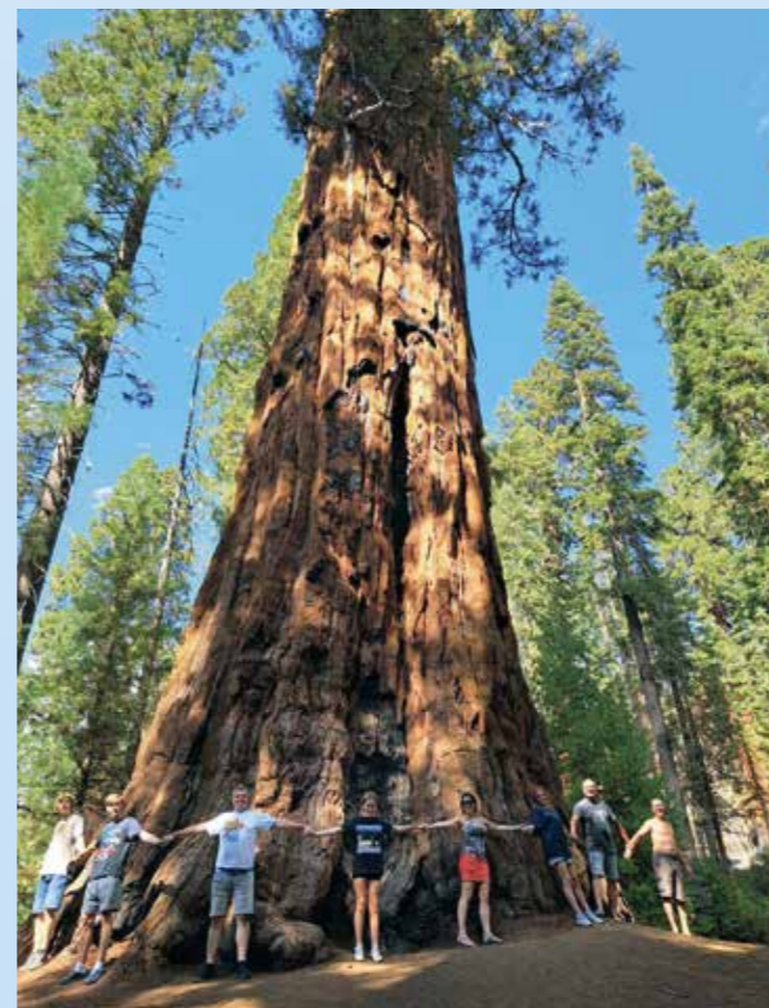
K obejmutí sekvojovníku je potřeba aspoň 15 lidí. Tolik nás nebylo. Výška a průměr kmene vás ohromí, ale to pomýšlení, že jsou tu už několik tisíc let!

horská silnice se klikatí nádhernou přírodou po stěnách hor a na hranách hlubokých srázů. Převodovce našeho Transitu se to ale nelíbí, desetistupňový automat je za trest, a tak celé stoupání řadím tlačítka +/- a modlím se, aby to transmise vydržela. Pobyť mezi gigantickými sekvojemi je ozdravný a motivující. Člověk si pod jejich korunami uvědomí, jaký je oproti nim mravenec a zároveň ho aspoň na chvíli