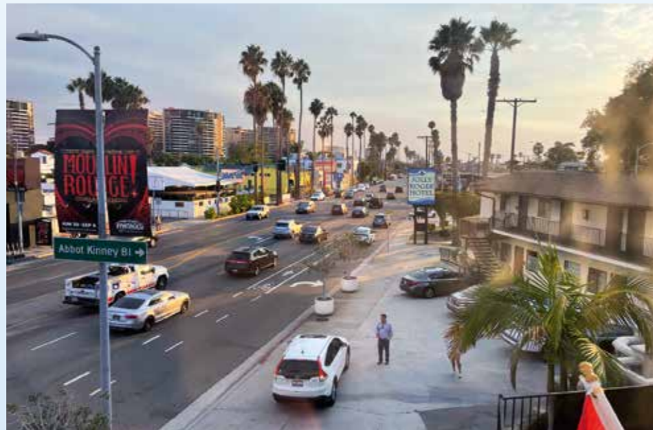
Hotel má podzemní garáže i pro light-trucky, příjemný personál a ještě akceptovatelné ceny. Tohle je výhled z okna na bulvár, který po jedné míli končí přímo u oceánu ve Venice Beach