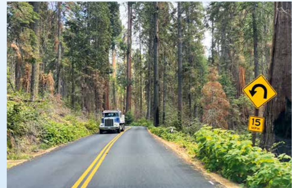
Velké trucky často potkáváte i na klikatých horských silnicích, ale tady před Sequoia Parkem bychom je nečekali. Značka upravující rychlost na 15 mph měla díky stoupání a poloměru zatáček své opodstatnění

hřeje mládí – sekvoje jsou staré až 3 tisíce let. Zpáteční cestou je při sjezdu do nížiny třeba brzdit motorem, proto celý sešup sjíždím opět pomocí řazení tlačítka. Zároveň přemýšlím, jak by si s tímto mohutným klesáním poradily brzdy našich prvoplánových padesátdevítek. Přijíždíme do jednoho z nejužasnějších míst na naší trase, do Motelu Buckeye Tree Lodge v malebném údolí Three Rivers. Přestože tudy vede