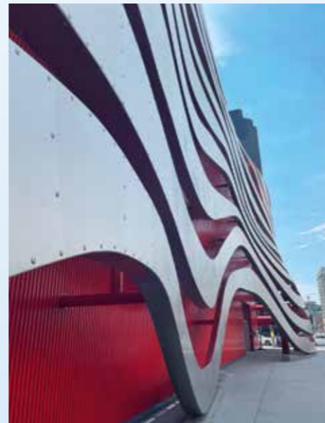
Petersonovo Muzeum v Los Angeles: unikátní fasáda z něj dělá nepřehlédnutelný objekt. Jeho návštěvu určitě doporučujeme!