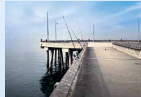
Venice Fishing Pier je absolutní ostuda Venice. Molo plné lidských i zvířecích exkrementů na dálku zapáchá a funkci už neplní ani pro otrlé rybáře