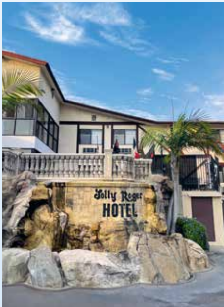
Jolly Roger Hotel na West Washington Blvd pro nás byl Fata Morgánou v přeplněném Los Angeles