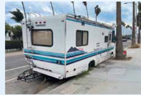
Na jedné míli jsem napočítal 15 RV určených k trvalému pouličnímu bydlení. Tenhle má jistou formu luxusu v podobě brumlačící elektrocentrály u PP kola