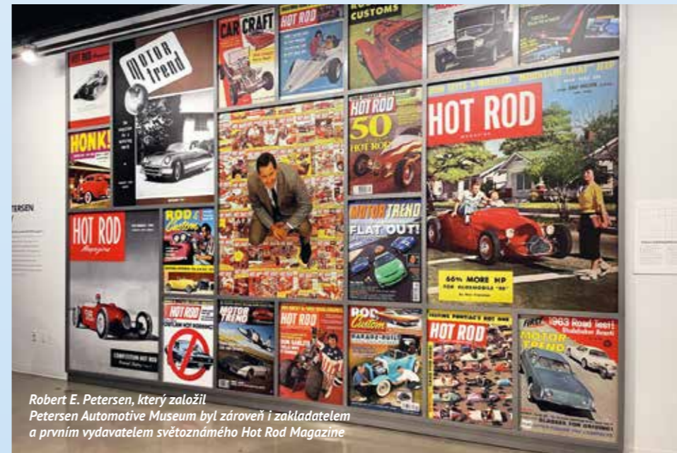
Robert E. Petersen, který založil Petersen Automotive Museum byl zároveň i zakladatelem a prvním vydavatelem světově známého Hot Rod Magazine

Oblast Three Rivers je známá tím, že se v ní hojně vyskytují medvědi. Informuje o tom množství výstražných cedulí na motelech a na silnicích. Z jejich přítomnosti jsme měli respekt a raději se k nim nepřibližovali