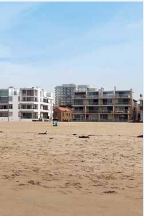
Venice Beach je téměř prázdná, na 200 metrech pláže najdete 5 lidí a z toho 1 surfaře. Návštěvu určitě nedoporučujeme a to nejen z důvodu, že hrozí šlápnutí na jehlu z injekční stříkačky. Tady opravdu není co k vidění...

k oceánu a rozhodl se zjistit, jestli ty báje o šílenostech ve Venice Beach jsou pravda nebo výmysl. Po mých osobních zkušenostech jsou bohužel pravdivé. Poloprázdná pláž s nejhorším rybářským molem, jaké si dovedete představit. Několik krajních vil od Mariny na pověstné Ocean Front Walk již vysquattovaných a restaurace na West Washington Blvd na úrovni kantýny v Novém Mexiku. Takže ano, přátelé, je to skutečně pravda, kdysi vyhlášené Venice v L.A. se obloukem vyhněte. Určitě si ale spravíte chuť a náladu na Santa Monica Pier